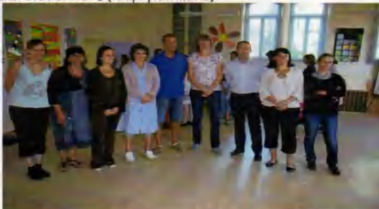
Prénoms et noms de gauche à droite