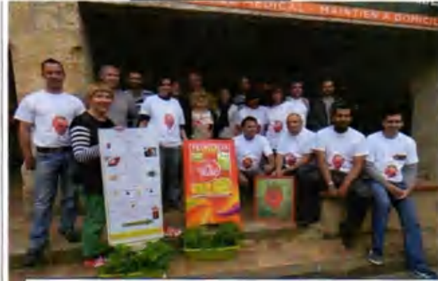
Le groupe des artisans et commerçants