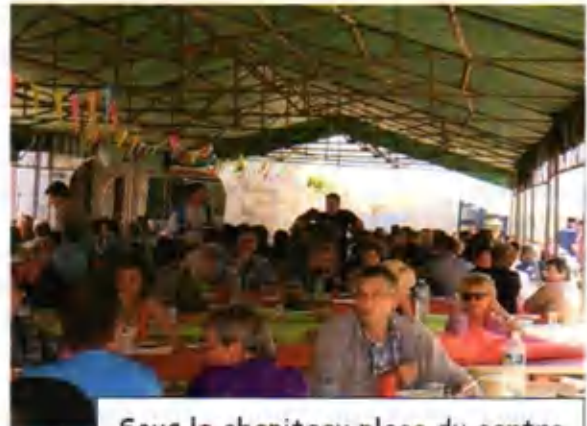
Sous le chapiteau place du centre

Les 31 mai et 1 juin : week-end moto et quad organisé par l'association « Des chiens verts »